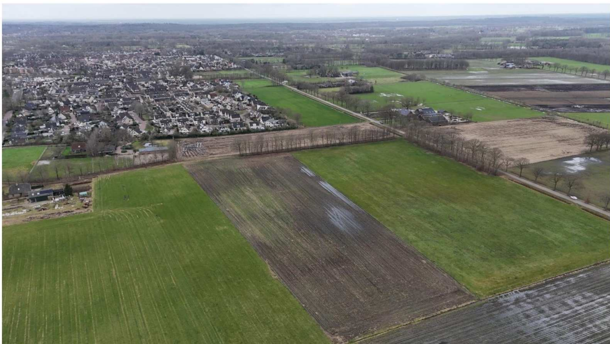
De beoogde locatie bevindt zich op een agrarisch perceel aan de Noordelijke Hoofddijk.

Het maximumaantal plekken dat onze raad als voorwaarde heeft meegegeven, ligt lager dan het aantal dat onze gemeente heeft gekregen als indicatieve opgave vanuit de spreidingswet (215). Omdat wij als gemeente zelf het initiatief hebben genomen voor opvang van asielzoekers, verwachten wij echter dat dit (voorlopig) voldoende zal zijn. Het maximumaantal dat de raad heeft meegegeven, blijft daarom het uitgangspunt.